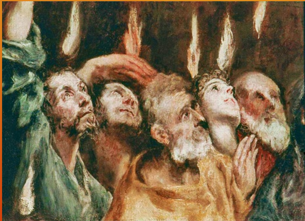
Pentecost (detail) by El Greco

A Szentlélek eszetekbe juttat mindent, amit mondtam nektek.