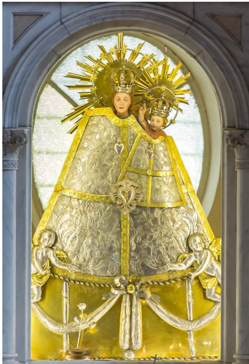
Kegyszobor, Máriagyűd

„Mindannyian egy szívvel, egy lélekkel állhatatosan imádkoztak az asszonyokkal, Máriával, Jézus anyjával és testvéreivel együtt.” (ApCsel 1,14)